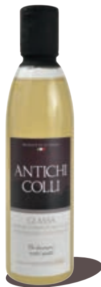
Condiment Blanc 250 ml : Ideale su carni bianche e pesce Perfect on white meat and fish Idéal avec de la viande blanche et poisson