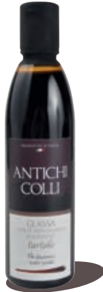
Truffe 250 ml : Ideale su formaggi stagionati, soufflé di riso e pane all'olio Perfect with ripened cheeses, rice soufflé and roasted bread with olive oil. Idéal sur fromages, riz soufflé, pain grillé avec huile d'olive.