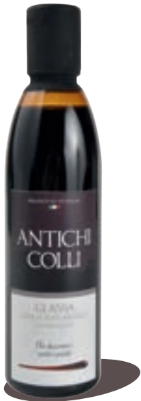
Classic 250 ml - 500 ml : Ideale su insalate e grigliate Perfect on salads, grilled meats or French fries Parfait sur des salades, viandes grillées ou frites.