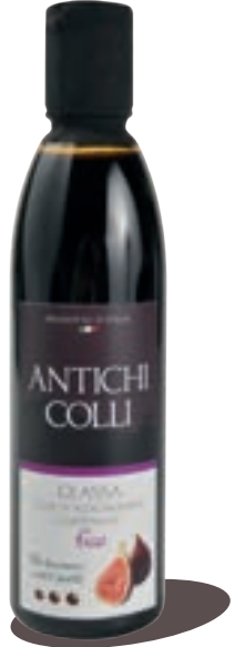
Figure 250 ml : Ideale su formaggi e carni rosse Perfect on fresh cheeses and red meat Idéal sur du fromage frais et de la viande rouge

Grazie alla sua elevata densità è ideale per decorare i piatti della cucina innovatrice stimolando l'inventiva dello chef. Il suo sapore evoca fedelmente quello dell'aceto balsamico originale e consente molteplici abbinamenti gastronomici.