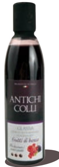
Fruits des bois 250 ml : Ideale su macedonie di frutta e dessert Perfect on fruit salad and dessert. Idéal dans une salade de fruit et des desserts.